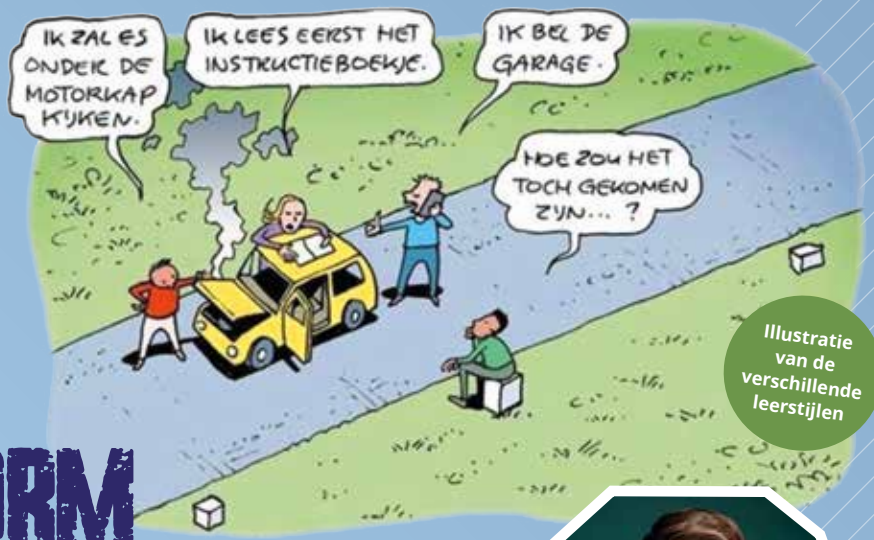
Illustratie van de verschillende leerstijlen

Stel, je hebt een inleiding voorbereid voor de JV-avond. Met behulp van PowerPoint breng je de boodschap over aan de groep. Na de pauze volgt er een ontspannende activiteit zonder duidelijke link naar de inleiding. Na afloop vraag je aan de groep wat de kernboodschap was. De reacties verschillen en lang niet iedereen heeft de kernboodschap begrepen of onthouden. Wat nu?