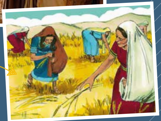
Ruth op het land van Boaz