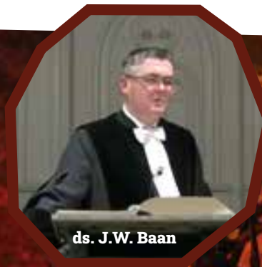
ds. J.W. Baan

Het is een heel vroeg kerkelijk besluit om in de weken voorafgaand aan de kerstdagen stil te staan bij advent. In de loop van de kerkgeschiedenis zijn dat 4 weken geworden. Advent komt van het Latijnse 'adventus' en betekent 'aankomst'. Wij zijn dan gewend om 4 zondagen stil te staan bij de komst van het Kind van Bethlehem naar deze aarde. Tegelijkertijd staan wij die 4 zondagen stil bij de wederkomst van de Zaligmaker op de wolken van de hemel. Aan het Paasfeest ging in de Vroege Kerk een tijd van 40 dagen vasten vooraf. Een tijd van boete en berouw behoort ons dan te brengen bij de lijdende Knecht van de Heere. Het is onze gewoonte om dan 7 lijdenszondagen aan te houden. Die zondagen volgen wij de Zaligmaker op de voet naar het kruis, en ontmoeten de lijdende Christus op de Goede Vrijdag op Golgotha.